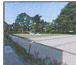
Jeux de boules Terrain stabilisé