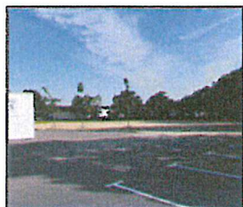
Vastes parkings et espaces verts

Un équipement pratique, facile d'accès, dans un site arboré et clôturé de 10.000 m 2 .