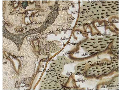
Extrait de carte de l'Etat major (1750-1815)

Ce projet vise à simplifier la circulation en hiérarchisant les routes et les espaces publics, dans le but d'améliorer la sécurité routière et de faciliter les déplacements. L'objectif principal est de restaurer les communications et les échanges entre les différents secteurs de la commune.